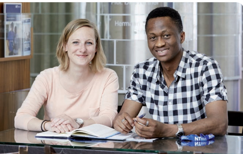
Am NIT leben und lernen Studierende aus der ganzen Welt gemeinsam.

am NIT in Hamburg. Nur etwa 30 High Potentials werden nach persönlichen Interviews, die über den ganzen Globus verteilt stattfinden, ausgewählt. Viele Studierende erhalten für ihr Studium Stipendien von Unternehmen und Stiftungen. Die Studierenden wohnen zumeist in Apartments im NIT-Gebäude direkt auf dem Campus der TUHH – internationaler Austausch inklusive.