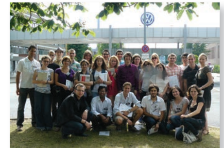
Teilnehmer eines European Workshops nach einem Tag bei VW

Bei allen Lehrveranstaltungen hat das gegenseitige Kennenlernen und der kulturelle Austausch einen hohen Stellenwert – sei es bei den gemeinsamen Freizeitaktivitäten in der jeweiligen Region, beim gemeinsamen Essen oder den zahlreichen Partys.